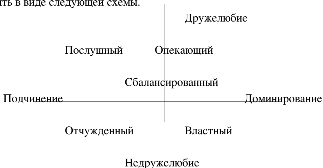
Рис.2. Стили речевого поведения по В.В.Латынову.

позволил выделить пять стилей речевого поведения, которые можно представить в виде следующей схемы.